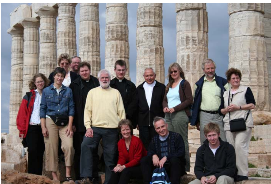
Vesperkreis vor dem Poseidontempel in Kap Sounion